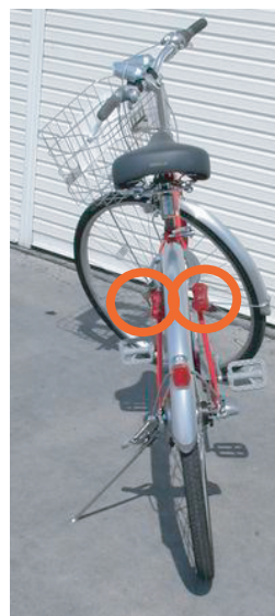
②サイドに2個装着の場合